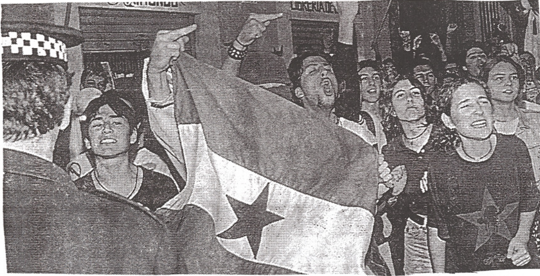
Un aspecto de la mani en Cádiz abucheando a un grupo de nostálgicos del franquismo

En este sentido podemos felicitar las manifestaciones que en torno al 20 N se desarrollaron en Granada (una 1.000 personas), Málaga (a 500) y Cádiz (400) y que tuvieron como fruto el impedir que esa fecha fuera motivo de envalentonamiento de los fachas.